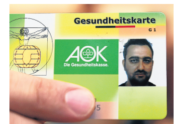
In Bremen gibt es die Gesundheitskarte für Flüchtlinge bereits seit zehn Jahren - hier die eines Syrers.

Bislang müssen Asylbewerber, die nicht mehr in Erstaufnahmestellen untergebracht sind, für jeden Arztbesuch einen Behandlungsschein beim zuständigen Sozialamt beantragen. Auch die Abrechnung ärztlicher Leistungen läuft über die Kommunen, was Mediziner als zu bürokratisch beklagen.